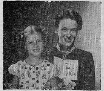
Regalele una o varias pólizas de

¡A ella le encantará obtener MIL COLONES EN EFECTIVO, de los $ 9.000.00 que sorteamos todos los meses!